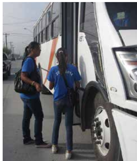
UDEM auspició talleres trimestrales para familias.