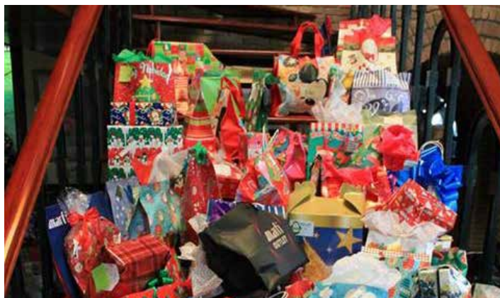
Se distribuyeron alrededor de 600 obsequios y 600 bolsitas de dulces.