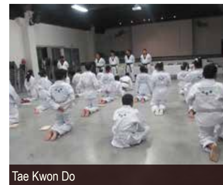
Tae Kwon Do

258 ALUMNOS REINGRESARON AL 24 DE ENERO, DE LOS MÁS DE 600 INSCRITOS A LA FECHA: