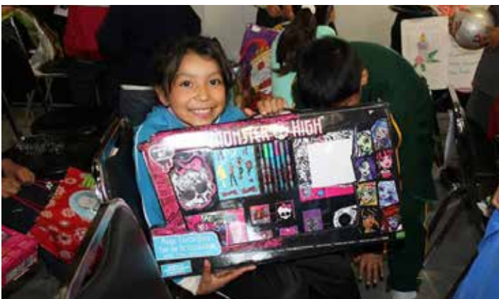
Repartición de juguetes.