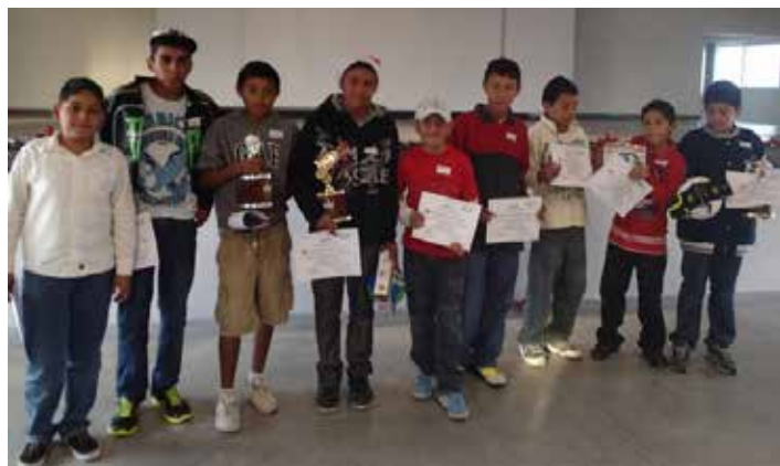
Entrega de reconocimientos a alumnos destacados.