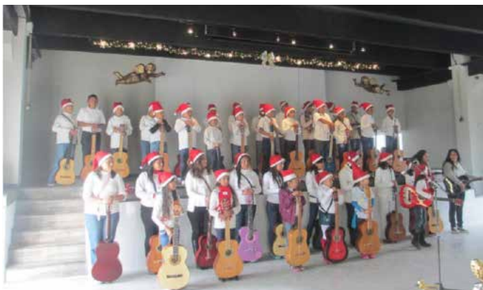
Estudiantes de guitarra del CCDSJ.

Cada niño recibió un obsequio navideño, y se repartieron diplomas y trofeos a los alumnos destacados en algunas de las disciplinas impartidas en el CCDSJ.