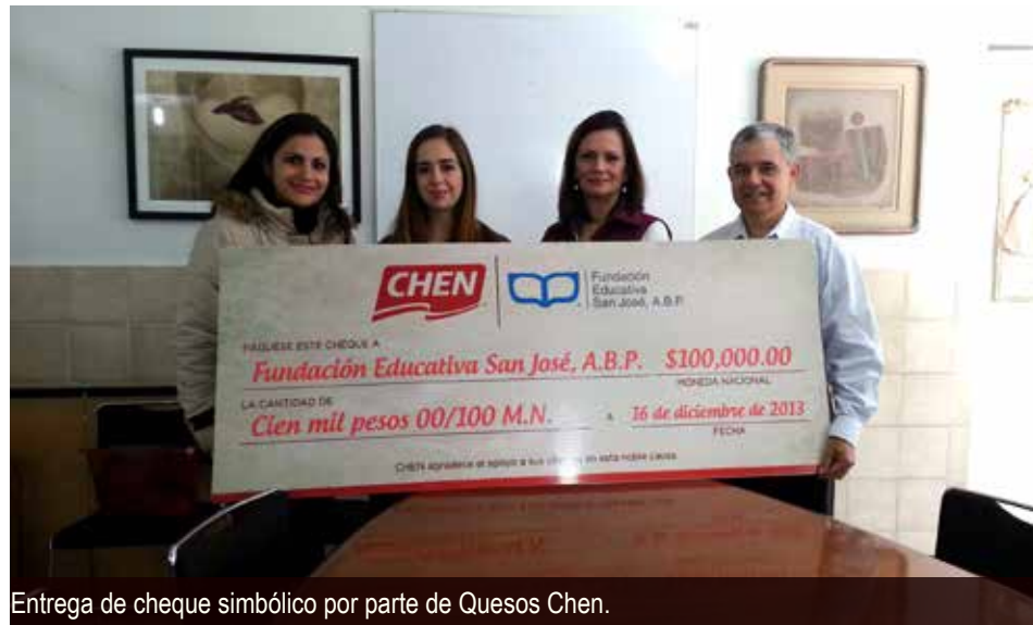
Entrega de cheque simbólico por parte de Quesos Chen.

En este reporte, externamos nuestro agradecimiento a Quesos Chen, empresa que entregó, recientemente un cheque con valor de $100,000.00, y a tiendas Oxxo, cuyo programa de redondeo acumuló $614, 231.29, ambos en beneficio de los programas de la Fundación.