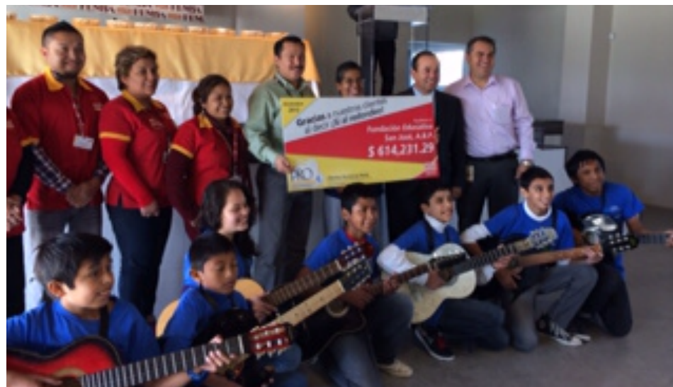
Reunión con representantes de tiendas Oxxo en el CCDSJ.