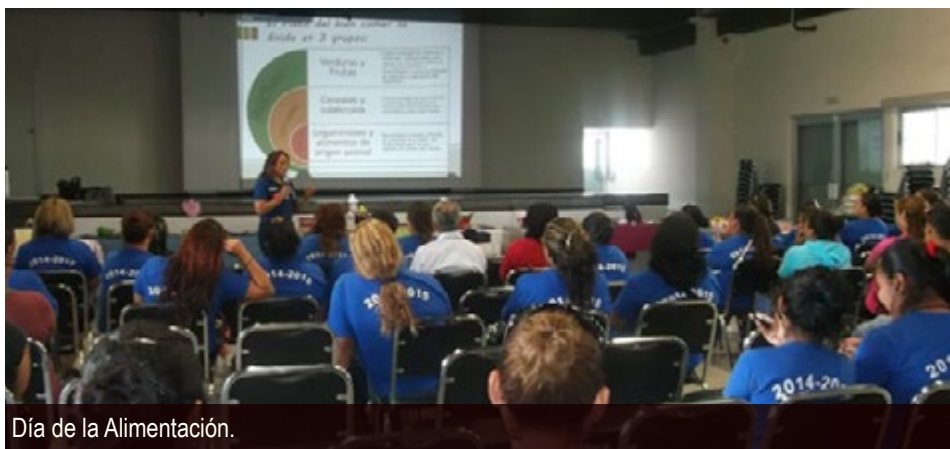
Día de la Alimentación.