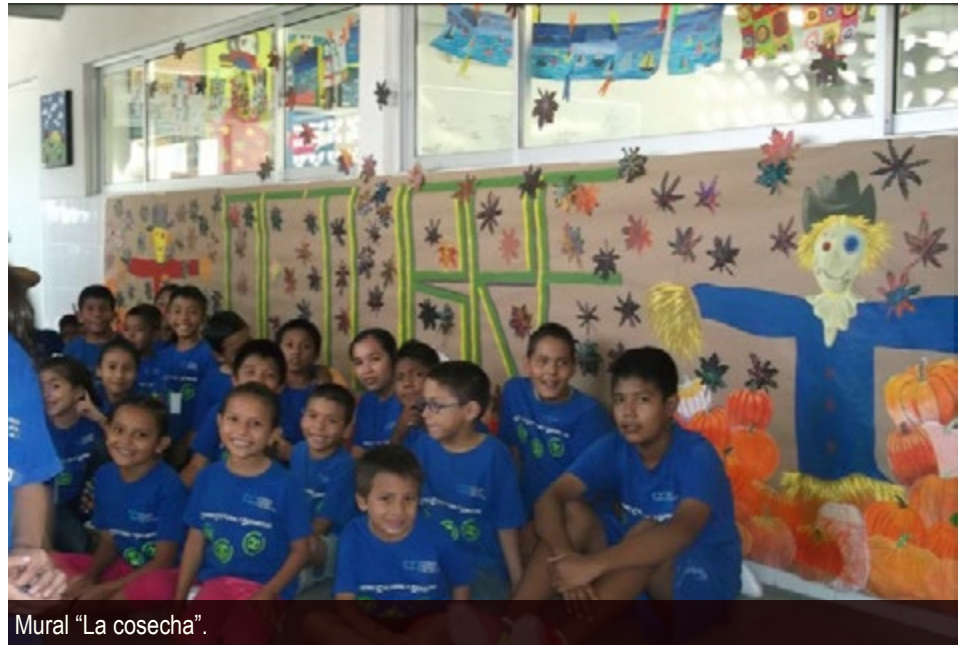
Mural "La cosecha".

El grupo de artes plásticas realizó un hermoso mural. Fue titulado "La cosecha" y exhibido en el pasillo del segundo piso del Centro.