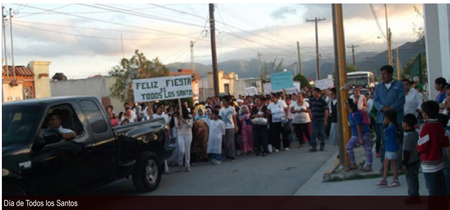
Día de Todos los Santos