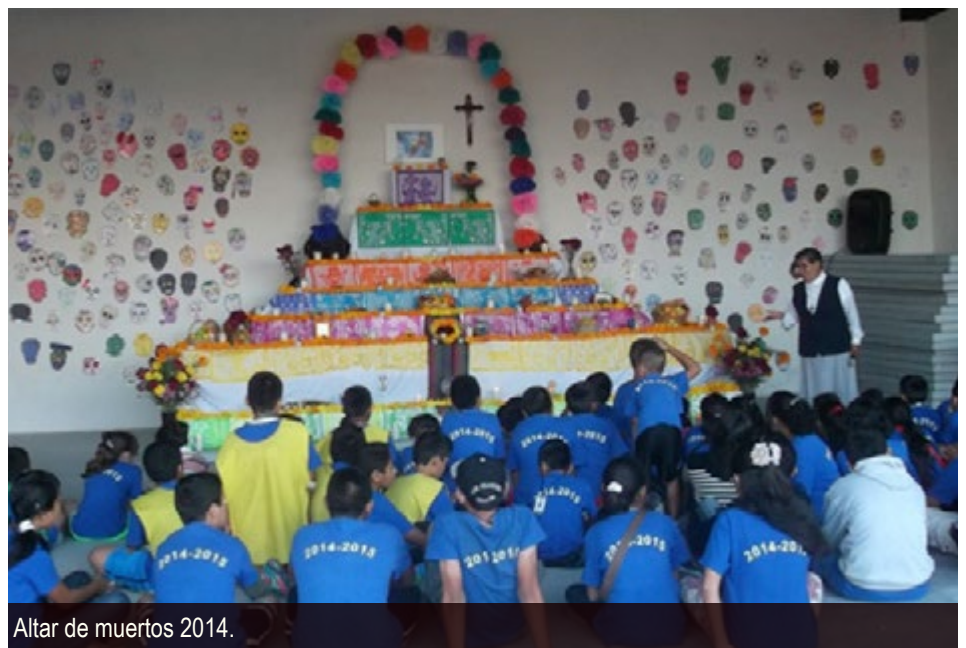
Altar de muertos 2014.

En otra actividad que nos mueve las fibras más profundas por las emociones que nos provoca, se hizo una convocatoria en la que participaron todos los maestros y alumnos para la elaboración de un altar de muertos que este año fue dedicado a dos niños de la comunidad.