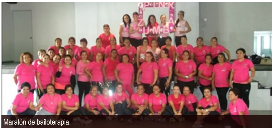
Maratón de bailoterapia.

Afortunadamente tenemos la posibilidad de prestar el CCDSJ a otros grupos o asociaciones que persiguen objetivos similares a los nuestros. Es por eso que a partir de ahora hemos decidido formalizar el proceso bajo la firma de una carta responsiva que garantice el buen uso de las instalaciones y el inmobiliario del Centro.